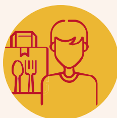
SUR LE LIEU DE VENTE