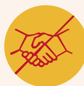
Limitier les contacts directs et indirects (objets)