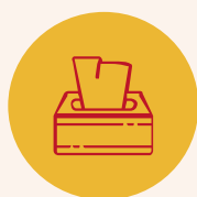
Utiliser un mouchoir à usage unique